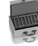
Ludwigsburg model 63403.00

Wagi, kolor i wymiary nie są wiążące. Zastrzegamy sobie możliwość zmian technicznych, wag, wymiarów i kolorów. Odchyłki wag, kolorystyki i wymiarów są uzależnione od warunków produkcyjnych. Przy transporcie i instalacji sejfów, które mogą stanowić zagrożenie przewróceniem, bezwarunkowo przestrzegaj instrukcji montażu i obsługi. Piktogramy nie są opisem technicznym produktu.