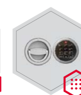
zamek elektroniczny Stellar Basic