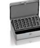
Ludwigsburg model 63402.00