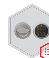
zamek elektroniczny Stellar Business