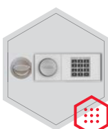
zamek elektroniczny B 90