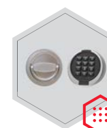
zamek elektroniczny Primor 3000 level 5