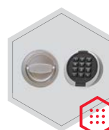
zamek elektroniczny Primor 3000 level 15