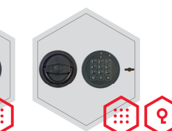
zamek elektroniczny z mechanicznym otwarciem awaryjnym (nie dotyczy art. 33200-33201)