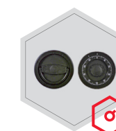
mechaniczny zamek szyfrowy (nie dotyczy art. 33200-33201)