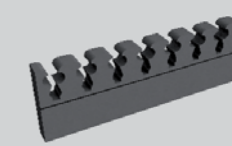
Uchwyt piankowy na broń, samo- przylepny, luzem (na 8 szt. broni) + dywanik piankowy