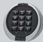
Zamek elektroniczny - Primor 3000 level 5 lub level 15