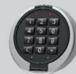
Zamek elektroniczny - Anchor 7000