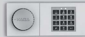
Zamek elektroniczny - B 90