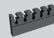
Uchwyt piankowy na broń, samo- przylepny, luzem (na 6 szt. broni) + dywanik piankowy