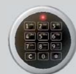
Zamek elektroniczny - 9-users