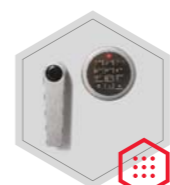
zamek elektroniczny Stellar Basic