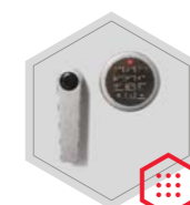
zamek elektroniczny 9-users