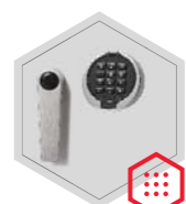
zamek elektroniczny Anchor 7000