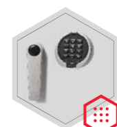
zamek elektroniczny Primor 3000 level 5 lub level 15