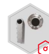
mechaniczny zamek szyfrowy