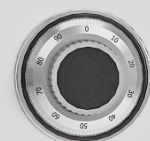
Mechaniczny zamek szyfrowy