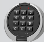
Zamek elektroniczny - Primor 3000 level 5