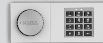
Zamek elektroniczny - B 30