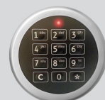
Zamek elektroniczny - Solar Business