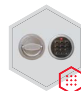
zamek elektroniczny Stellar Basic