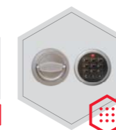
zamek elektroniczny Stellar Business