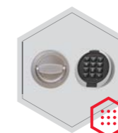
zamek elektroniczny Primor 3000 level 5 lub level 15