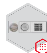
zamek elektroniczny B 90