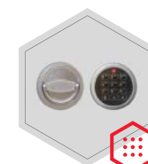
zamek elektroniczny Stellar Basic