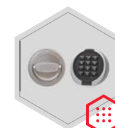
zamek elektroniczny Primor 3000 level 5