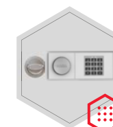
zamek elektroniczny B 90