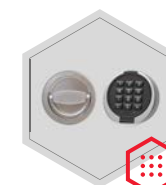
zamek elektroniczny Primor 3000 level 15