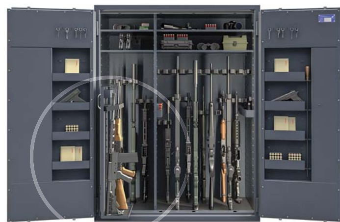
RUCHOMA ŚCIANKA NA BROŃ zamykana do wewnątrz