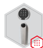
zamek elektroniczny Primor 3000 level 15