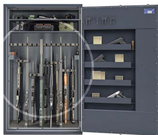
PRZESTAWNE UCHWYTY NA BROŃ na szynach i na magnesach