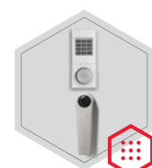
zamek elektroniczny B 90