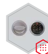
zamek elektroniczny Stellar Basic