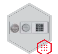
zamek elektroniczny B 90