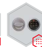
zamek elektroniczny Stellar Business