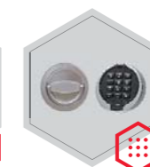
zamek elektroniczny Primor 3000 level 5 lub level 15