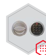
zamek elektroniczny Stellar Basic