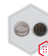
zamek elektroniczny Stellar Business