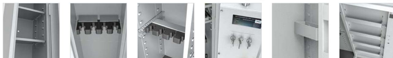
przewidywana półka przestawne uchwyty na broń na magnesach (pianka o rozstawie 55mm) przestawna szyna na broń (pianka o rozstawie 65mm) listwa hakowa pojemniki do zawieszania półki przestawne na drzwiach