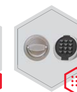
zamek elektroniczny Primor 3000 level 15