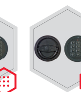
zamek elektroniczny z mechanicznym otwieraniem awaryjnym