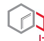
Drzwi dwuściankowe o grubości 52 mm